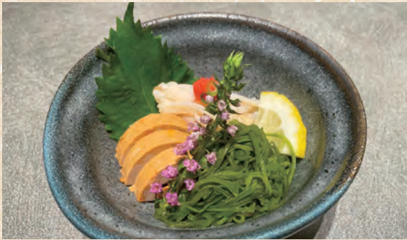
ポン酢 de 珍味三味盛 (写真の内容は一例です)