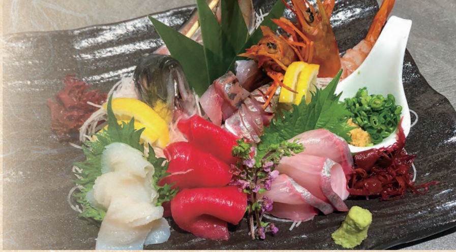
刺身盛り合わせ五点盛りのイメージ