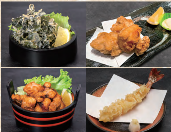
左上/天然わかめ唐揚げ 右上/鶏唐揚げ (3個) ~肉の旨さ際立つ薄衣仕立て 左下/たこの唐揚げ 右下/大海老天 (1本)