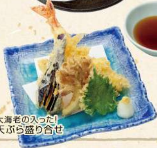
大海老の入った! 天ぶら盛り合せ