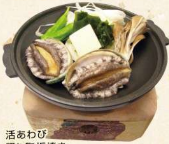
活あわび踊り陶板焼き