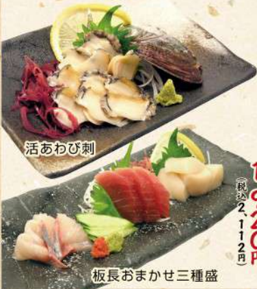
板長おまかせ三種盛